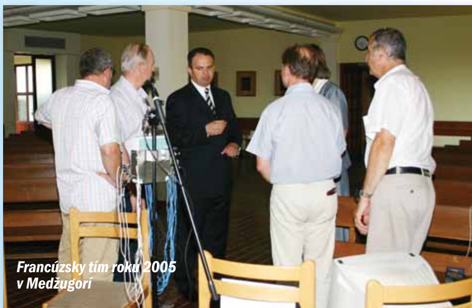
Francúzsky tím roku 2005 v Medžugorí

„Mnohých som podnietil k tomu, aby navštívili Medžugorie: zdraví a chorí, neveriaci a veriaci, skeptickí rehoľníci, vedci a jednoduchí ľudia,